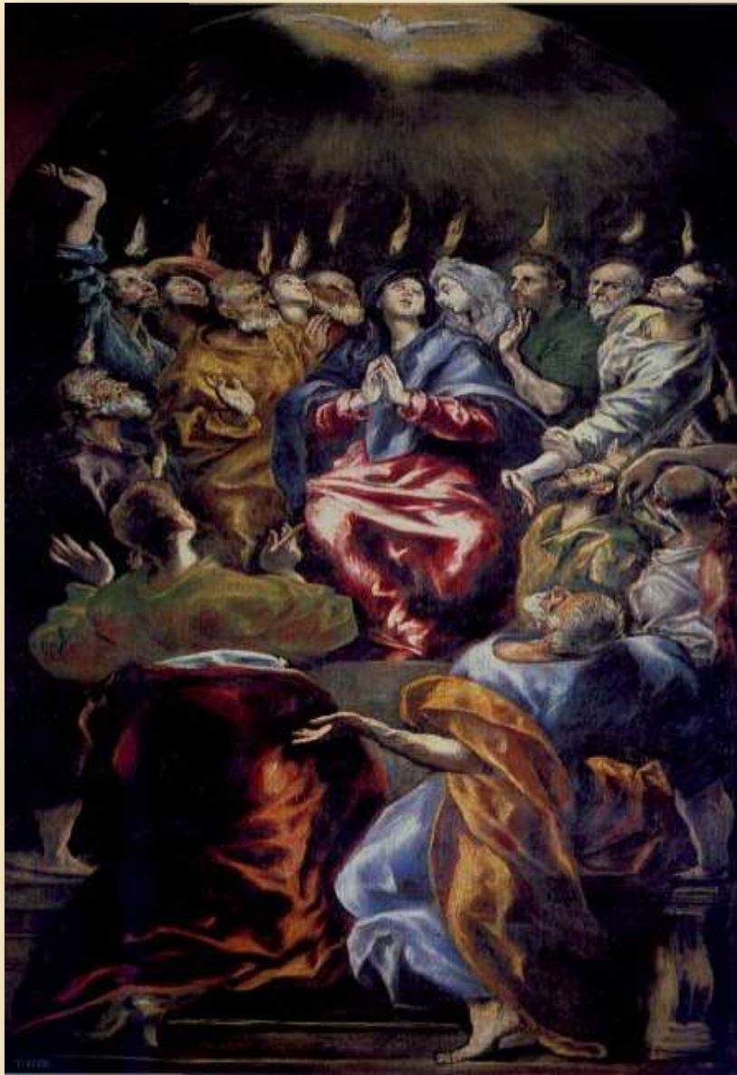
Δομήνικος Θεοτοκόπουλος (Ισπανία, 1597 - 1616)